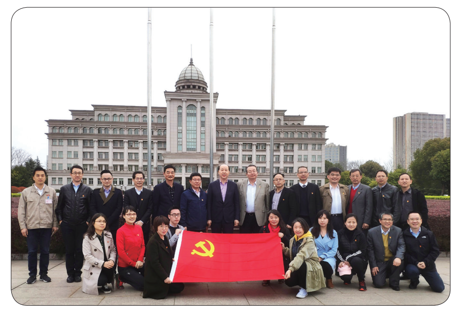
嘉兴石化“职工之家”投用啦

在展示中心，参加共建活动的党员们认真听取了桐昆的发展历史和产业分布，特别是对桐昆的“红色治理”党建工作和丰富组织的文化支持力。双方还就如何融合生产、党员如何更好地发挥先锋模范作用作用等方面进行了探讨交流。