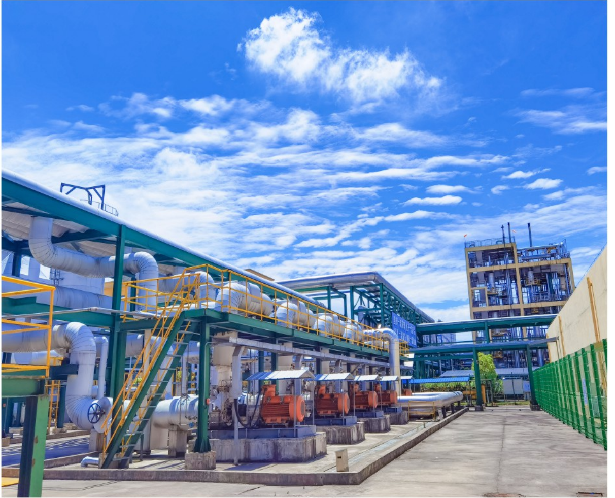
■蓝天下的桐昆 恒优公司 张俞 摄